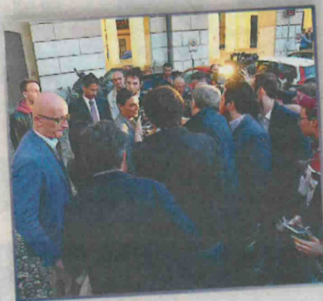
Scatti della serata di lunedì 8 maggio